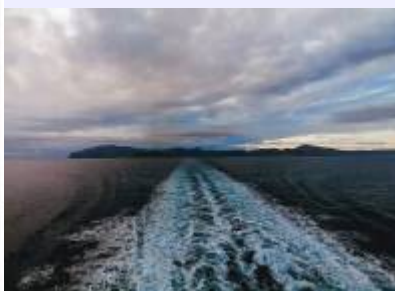
Bild 2: Die Insel Amorgos wie man sie von der Fähre aus sieht, Blickrichtung aus Nordwest nach Südost.