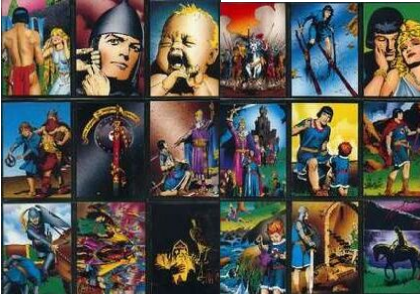
Abb.2: Sammelkarten (Auszug)