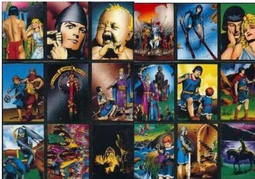
Abb.2: Sammelkarten (Auszug)