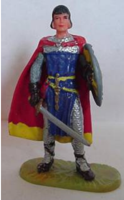
Abb. 4: Prinz Eisenherz in Elastolin