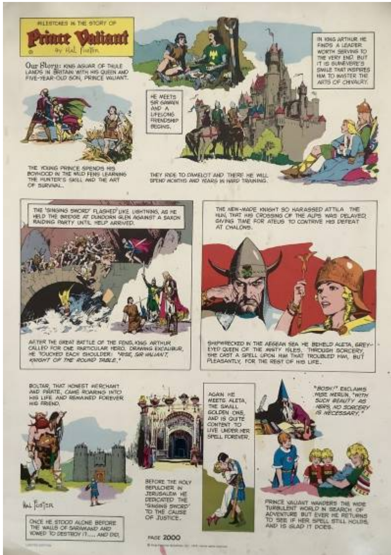
Abb.6: Sonderdruck Seite 2.000