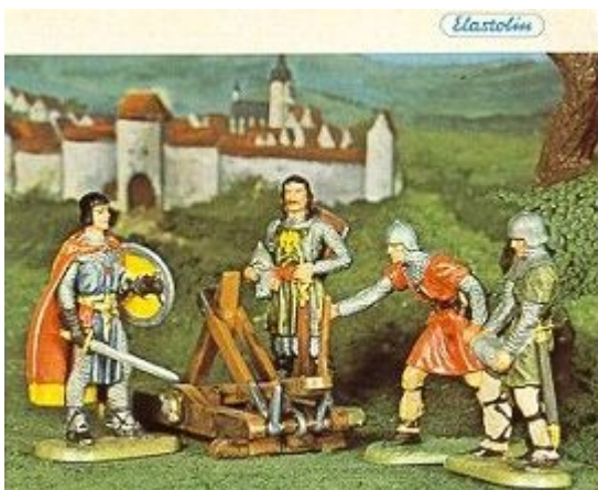
Abb.11: Prinz Eisenherz und Gawain aus einem Hausser Elastolin-Katalog