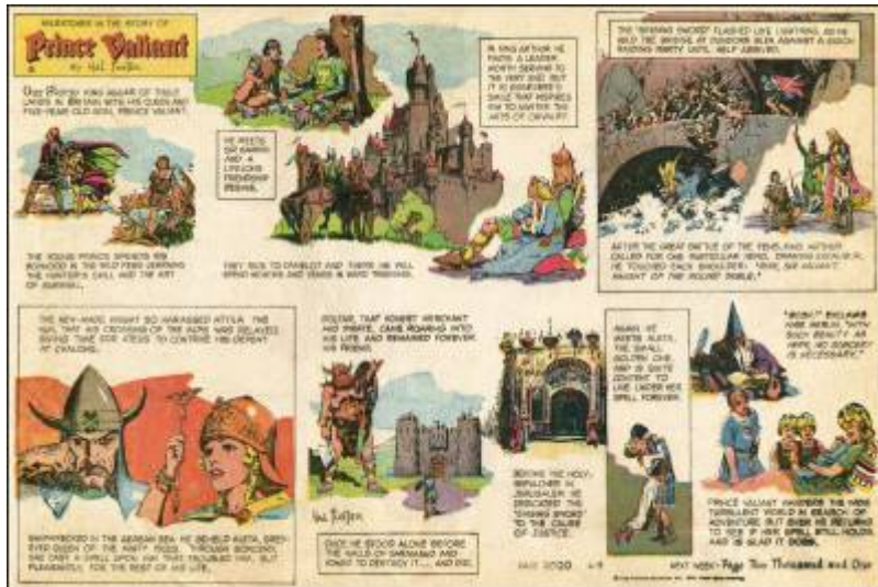
Abb.8: Sonntagsseite 2.000 vom 8.6.1975