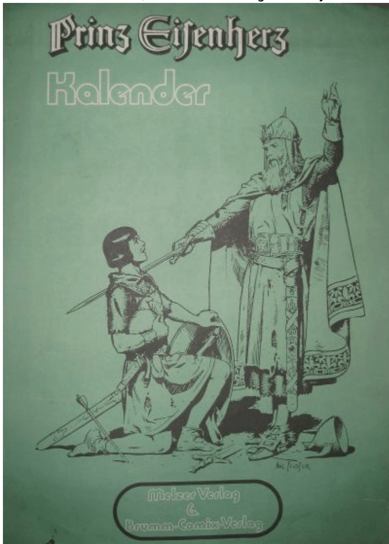
Abb.9: Kalender 1972

12 Einzelbilder von Sonntagsseite 4x und 4y © Melzer Verlag / Brumm-Comix-Verlag Druck: Schwab Offset, Klein-Krotzenburg. Grafik: J.Rombach, Buchschlag